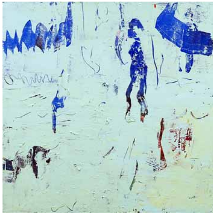
「踊る子供たち」アクリル、油彩、キャンバス 91×91cm 2019年