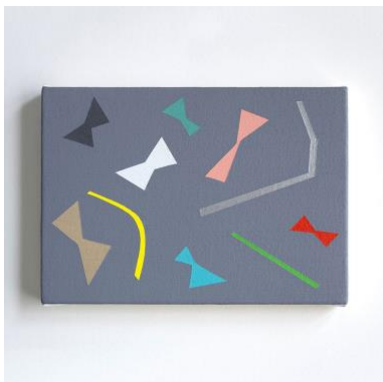
9. “r/b-04(ribbon / butterfly)” acrylic on cotton, 15x21cm, 2019