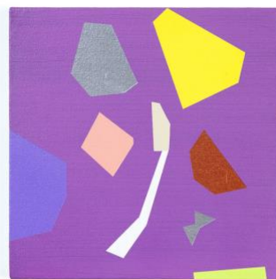
4. “p/f-01(piece/flower)” acrylic on cotton, 27x27cm, 2019