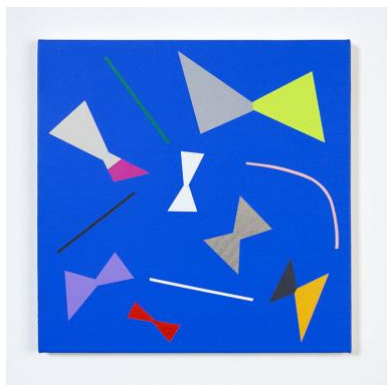
1. “r/b-02(ribbon / butterfly)” acrylic on cotton, 41x41cm, 2019