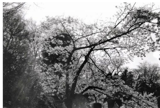
5. 「Park Park Park」 ゼラチンシルバープリント 8×10inch(20.3×25.4cm) ed. 12 2019