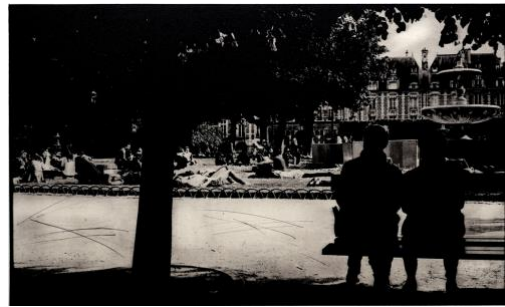
2. “peace” フォトポリマーグラヴェール、ドライポイント、雁皮刷り 175×297mm ed. 7 2019