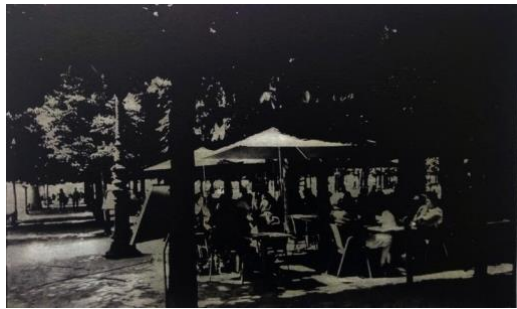
3. “lunch” フォトポリマーグラヴェール、ドライポイント、雁皮刷り 175×297mm ed. 7 2019