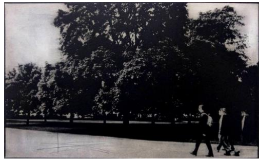
4. “Saturday” フォトポリマーグラヴェール、ドライポイント、雁皮刷り 175×297mm ed. 7 2019