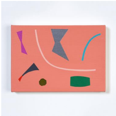
7. “a-z-03(annai-zu)” acrylic on cotton, 15x21cm, 2019