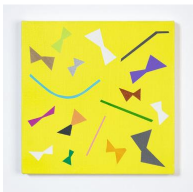
3. “r/b-03(ribbon / butterfly)” acrylic on cotton, 27x27cm, 2019