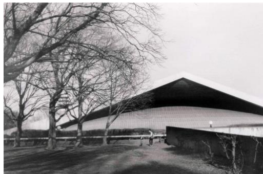
2. 「Park Park Park」 ゼラチンシルバープリント 8×10inch(20.3×25.4cm) ed. 12 2019