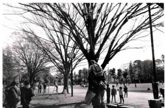
4. 「Park Park Park」 ゼラチンシルバープリント 8×10inch(20.3×25.4cm) ed. 12 2019