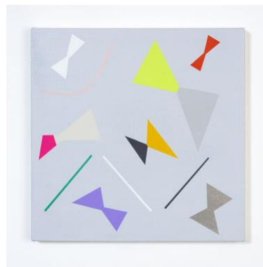
2. “r/b-01(ribbon / butterfly)” acrylic on cotton, 41x41cm, 2019