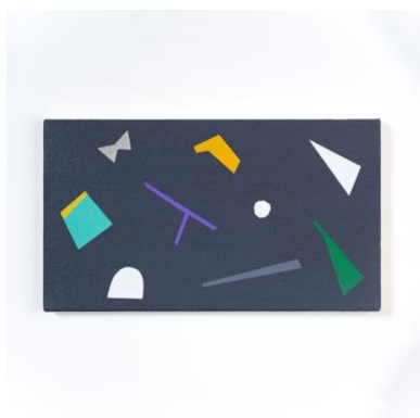
5. “a-z-01(annai-zu)” acrylic on cotton, 19x33.5cm, 2019