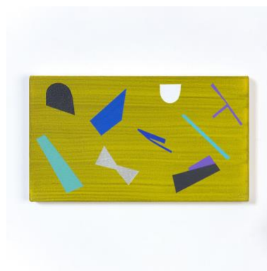
6. “a-z-02(annai-zu)” acrylic on cotton, 19x33.5cm, 2019