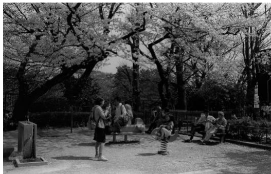
1. 「Park Park Park」 ゼラチンシルバープリント 8×10inch(20.3×25.4cm) ed. 12 2019