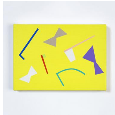
8. “f/g-02(flag/game)” acrylic on cotton, 15x21cm, 2019