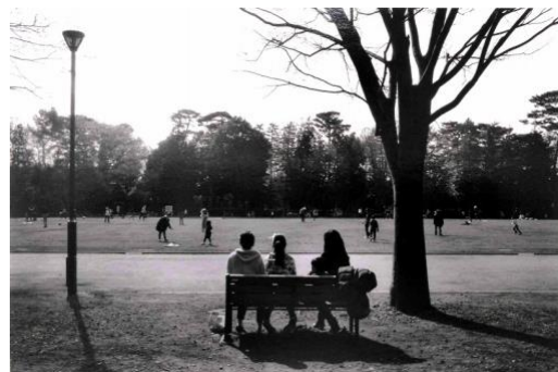
8. 「Park Park Park」 ゼラチンシルバープリント 8×10inch(20.3×25.4cm) ed. 12 2019