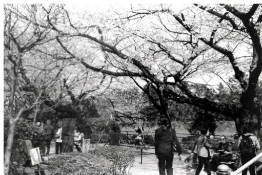
7. 「Park Park Park」 ゼラチンシルバープリント 8×10inch(20.3×25.4cm) ed. 12 2019