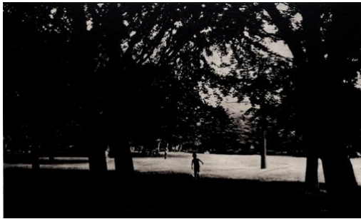
1 “in the park” フォトポリマーグラヴェール、ドライポイント、雁皮刷り 175×297mm ed. 7 2019