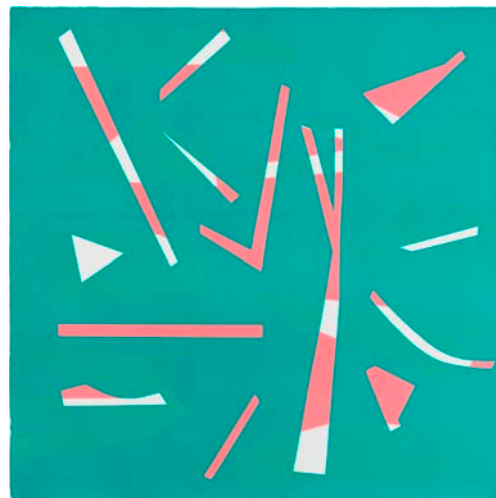
“t.p.” 70x70cm 油性木版 2017