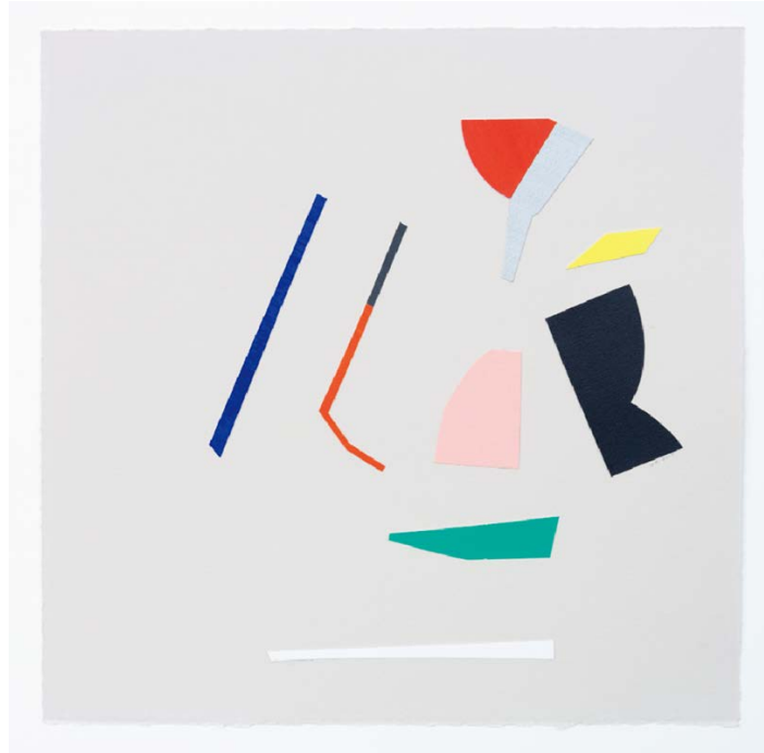
“n. d. -4” (night dew) collage, cut-out acrylic painted paper on paper 25x25cm 2017