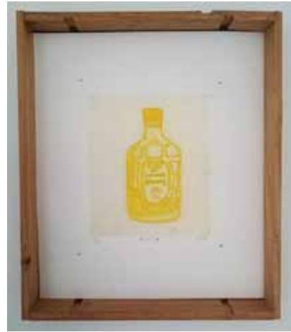
「サントリー 角」 ディープエッチング、雁皮刷り 2016 ed. 20