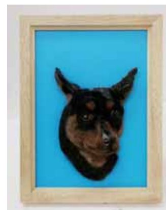
「夏大好き」(ミニチュアピンシャー) 羊毛フェルト、ブローチ台 フェルティングニードル 20.0×15.0cm 2016