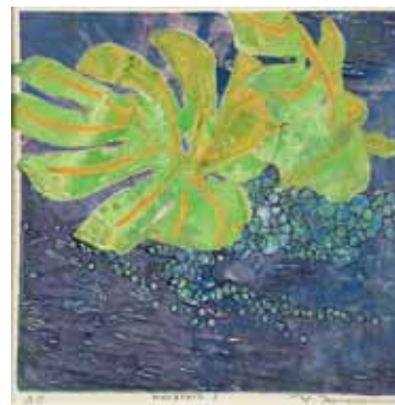
「Monstera 3」27×27cm 木版コラグラフ 2015