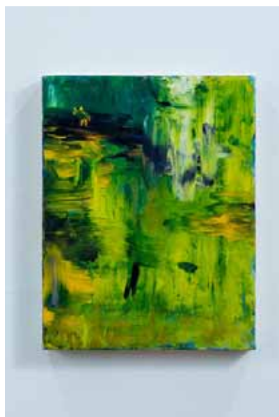
「羽音を聴く」油彩、綿布 41×32cm 2016

2016 「柳沢雑貨店」 柳沢画廊 (埼玉・さいたま) 2016 「どこかでお会いしましたね」 うらわ美術館一般展示室 (埼玉・さいたま) 「ing NOW」 うらわ美術館一般展示室 (埼玉・さいたま) 2015 「紙の上の思考 Thoughts through Drawings -mind」 Gallery 慳 SATORU (東京・吉祥寺) 2014 「柳沢雑貨店」 柳沢画廊 (埼玉・さいたま) 「BLACK WHITE MONOTONE」 Gallery 慳 SATORU (東京・吉祥寺) 2013 「絵画の在処 阿部隆・大友洋司・渡辺伸」 白矢アートスペース (東京・小平) 「Collection Summer」 Gallery 福果 (東京・神田) 「mille-feuille」 Gallery 慳 SATORU (東京・吉祥寺) 2012 「迎春展」 Gallery 慳 SATORU (東京・吉祥寺) 2011 「銅版画工房展」 コバルト画房 (埼玉・さいたま) ('09他) 「色考 | 白」 Gallery 慳 SATORU (東京・吉祥寺) 2010 「情景-痕跡」 渡辺 伸・大友洋司 展 白矢アートスペース (東京・小平) 「FLOWER」 Gallery 慳 SATORU (東京・吉祥寺) 2008 「京橋 3-3-8」 藍画廊 (東京・銀座)、 「小さい版画」 柳沢画廊 (埼玉・さいたま) 2007 「DEBLI project」 ギャラリー・ルデコ LE DECO、スターボックス他 (東京・渋谷) 「ALL IN LINE」 柳沢画廊 (埼玉・さいたま) 2006 「2006 New Year's card by Japan Artists」 (ベオグラード他3ヶ所/セルビア) 2005 「定点 -それぞれの世界-」 Gallery 慳 SATORU (東京・吉祥寺) 2003 「Beauty」 東京都美術館 (東京・上野) 「Multiple&Artist good exhibition」 Gallery 慳 SATORU (東京・吉祥寺) 2002 「SUPERPOSITION」 Gallery 慳 SATORU (東京・吉祥寺) 2001 「ACROSS THE UNIVERSE '01」 現代アーティストセンター展 東京都美術館 (東京・上野)