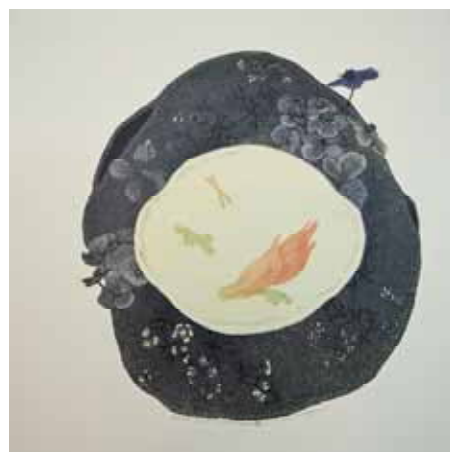
「テイストの振る舞い」木口木版 30x30cm 2015 e.d6