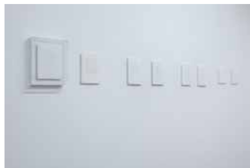
「紙の上の思考／Thoughts through Drawings」展示風景