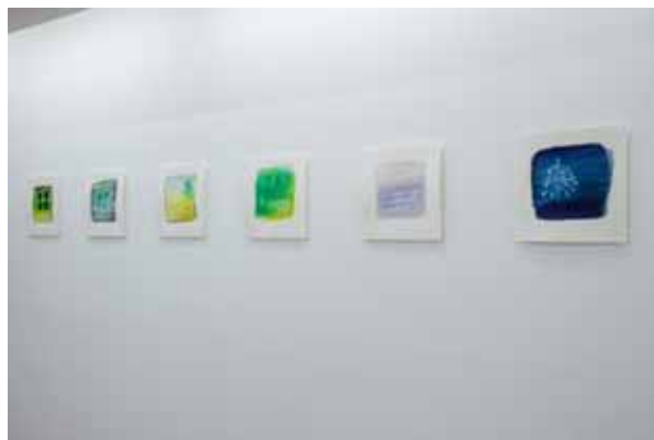
「紙の上の思考／Thoughts through Drawings」展示風景