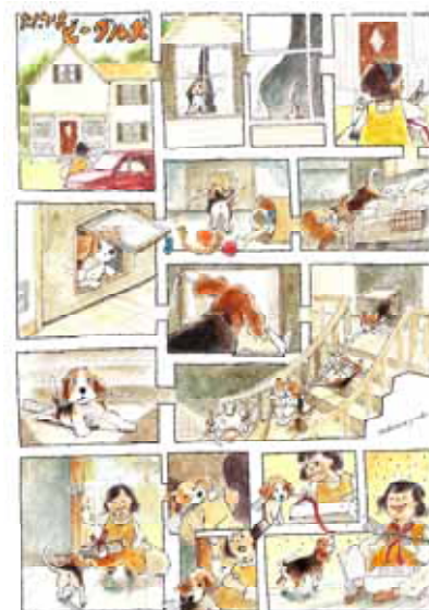
「ただいま！ビーグル犬」 A3 297 x 420mm 紙に水彩、ペン 2016