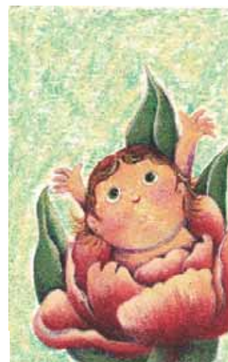
「おやゆび姫」 アクリル絵の具・クレパス 画用紙 86×143mm 2016

Life with Dog (Gallery 慍 SATORU 2016.5.21~6.5.) さんいんてん (にじ画廊 2016.7.7.~12.) ++ (タスタス) 第3回グループ展「むかしむかし。。。」 (代々木アートギャラリー)