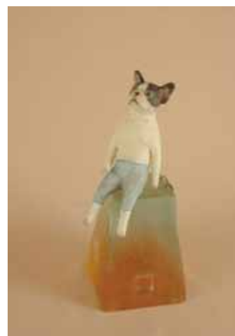
「屋上で・・・」 石粉粘土、ガラス 20.5×8.7×7.6 (H×W×D) cm 2014