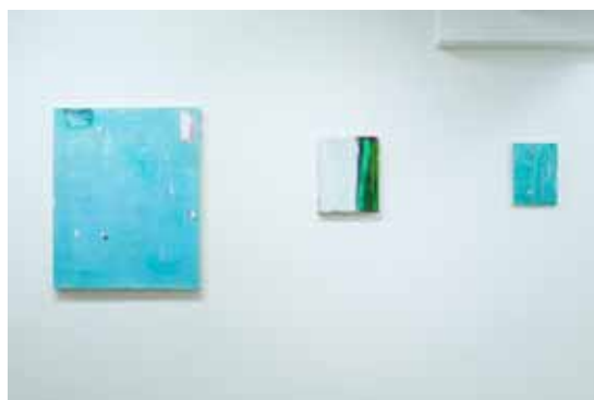
“循環 - 風と水と大地” 展示風景 13