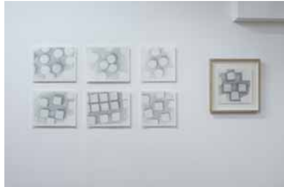
「空間を埋めるためのドローイング」紙、鉛筆 2016