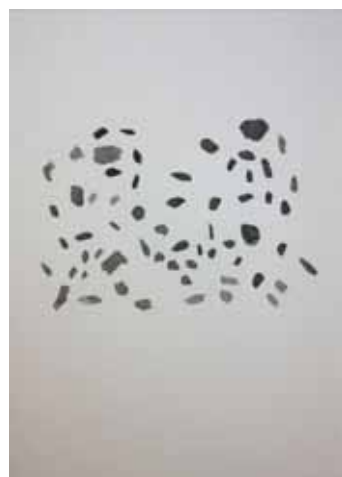
「黒雲母」333x242mm 墨、紙 2015