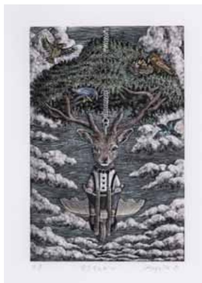
「空をずんずん」14.8×9.8cm 木口木版画手彩色・雁皮紙 2016