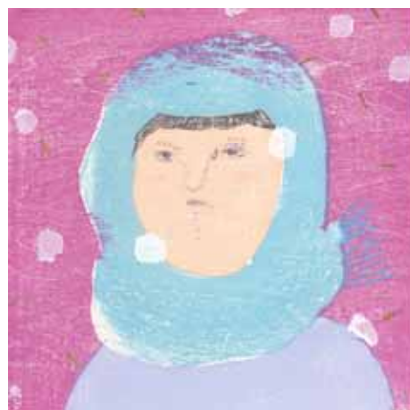
「carol III」 15×15cm 水性木版・和紙 ed.20