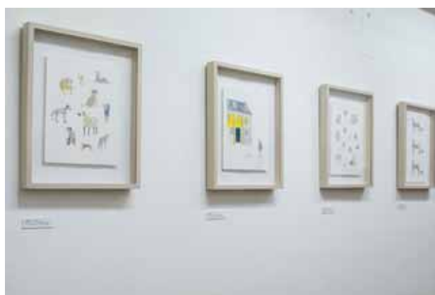
“Life with Dog” 展示風景

1989 東京都生まれ 2009 城東職業能力開発センター アパレルパターンナー科 卒業 2016 マネージメント事務所 UpperCrust に所属 2016 Life with Dog Gallery 惺 SATORU 東京 web http://arthousewyeth.com/