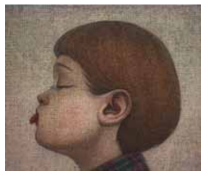
「ペー」 acrylic on canvas 38.5×46cm 2016

2008 FIXED POINT 08 Gallery 惺 SATORU / 東京 2010 FLOWERS~like a wildflower Gallery 惺 SATORU / 東京 2012 迎春 Gallery 惺 SATORU / 東京 2013 mille-feuille Gallery 惺 SATORU / 東京 2015 ANIMALS ATELIER・K / 神奈川 私のなかのアンデルセン Gallery 惺 SATORU / 東京 2016 Life with Dog Gallery 惺 SATORU / 東京