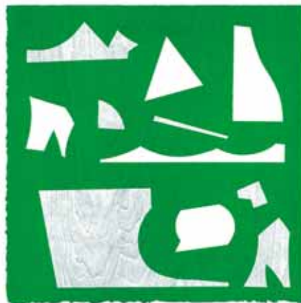
“g.p.” Woodblock printing, oil based ink printed on paper 25x25cm 2015