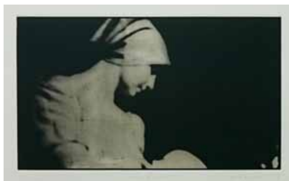
「.mother & child」 175×297mm ed.20 2016 フォトポリマーグラヴュール、ドライポイント、雁皮刷り photopolymer gravure, dry point on chine colle