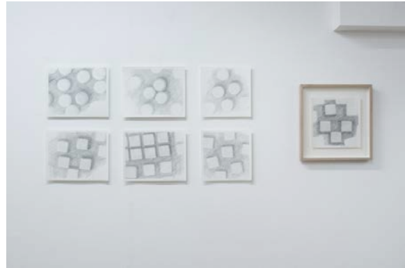
「空間を埋めるためのドローイング」紙、鉛筆 2016