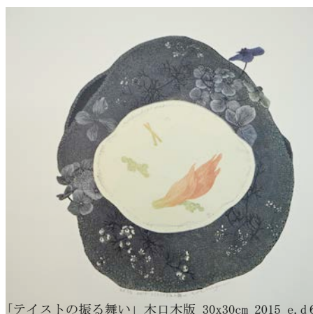
「テイストの振る舞い」木口木版 30x30cm 2015 e.d6