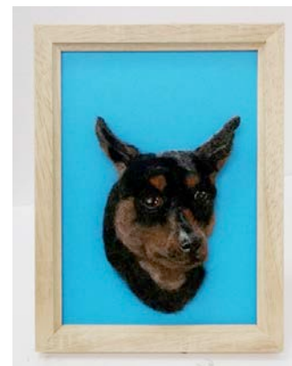
「夏大好き」(ミニチュアピンシャー) 羊毛フェルト、ブローチ台 フェルティングニードル 20.0×15.0cm 2016