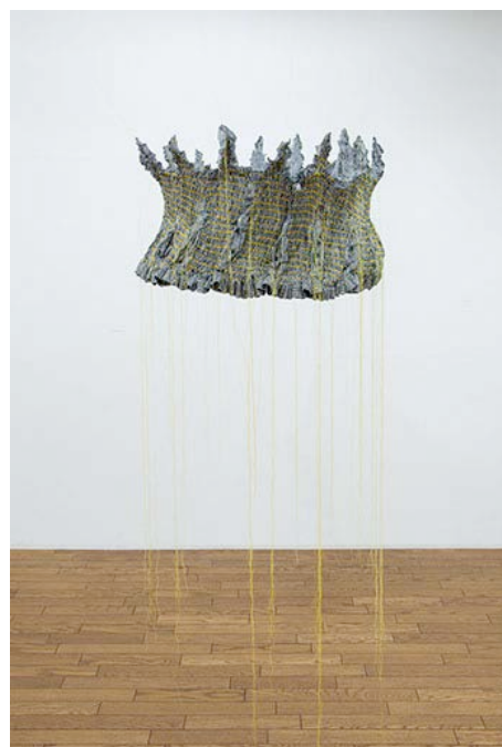
「酒井稚恵 王さまとカテドラル」展示風景