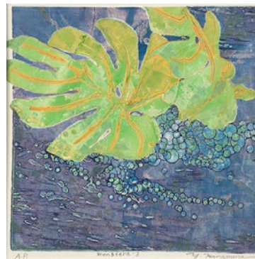
「Monstera 3」27×27cm 木版コラグラフィック 2015