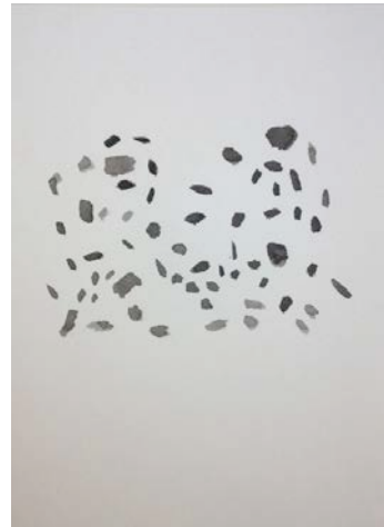
「黒雲母」333x242mm 墨、紙 2015