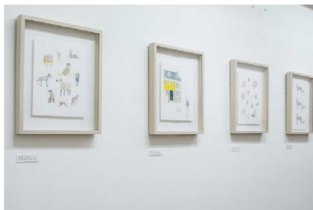
“Life with Dog” 展示風景

1989 東京都生まれ 2009 城東職業能力開発センター アパレルパターンナー科 卒業 2016 マネージメント事務所 UpperCrust に所属 2016 Life with Dog Gallery 惺 SATORU 東京 web http://arthousewyeth.com/