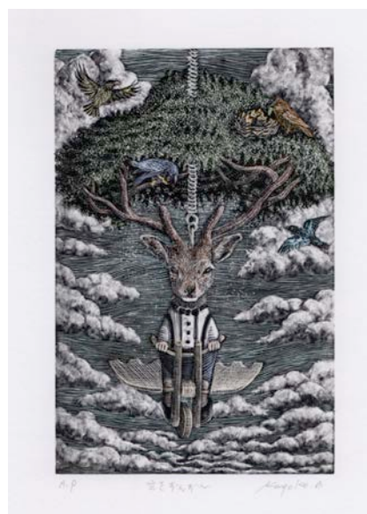
「空をずんずん」14.8×9.8cm 木口木版画手彩色・雁皮紙 2016