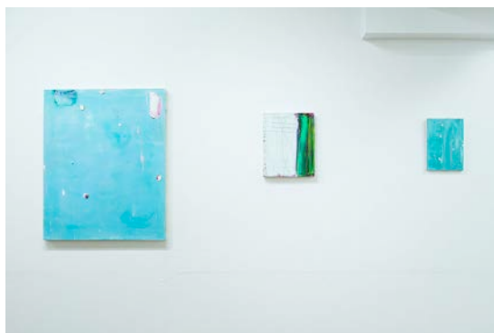
“循環 - 風と水と大地” 展示風景 13