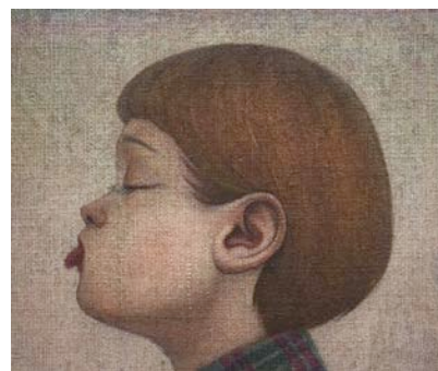
「ペー」 acrylic on canvas 38.5×46cm 2016

2008 FIXED POINT 08 Gallery 惺 SATORU / 東京 2010 FLOWERS~like a wildflower Gallery 惺 SATORU / 東京 2012 迎春 Gallery 惺 SATORU / 東京 2013 mille-feuille Gallery 惺 SATORU / 東京 2015 ANIMALS ATELIER・K / 神奈川 私のなかのアンデルセン Gallery 惺 SATORU / 東京 2016 Life with Dog Gallery 惺 SATORU / 東京