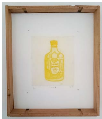
「サントリー 角」 ディープエッチング、雁皮刷り 2016 ed. 20