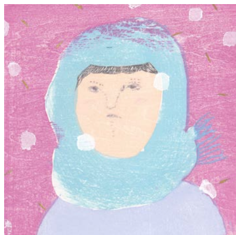
「carol III」 15×15cm 水性木版・和紙 ed.20