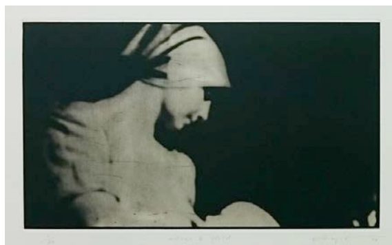
「.mother & child」 175×297mm ed. 20 2016 フォトポリマーグラヴュール、ドライポイント、雁皮刷り photopolymer gravure, dry point on chine colle