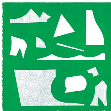
“g.p.” Woodblock printing, oil based ink printed on paper 25x25cm 2015