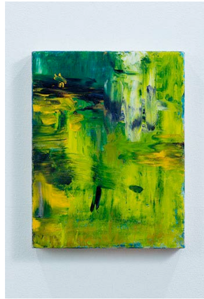
「羽音を聴く」油彩、綿布 41×32cm 2016

2016 「柳沢雑貨店」 柳沢画廊 (埼玉・さいたま) 2016 「どこかでお会いしましたね」 うらわ美術館一般展示室 (埼玉・さいたま) 「ing NOW」 うらわ美術館一般展示室 (埼玉・さいたま) 2015 「紙の上の思考 Thoughts through Drawings -mind」 Gallery 慳 SATORU (東京・吉祥寺) 2014 「柳沢雑貨店」 柳沢画廊 (埼玉・さいたま) 「BLACK WHITE MONOTONE」 Gallery 慳 SATORU (東京・吉祥寺) 2013 「絵画の在処 阿部隆・大友洋司・渡辺伸」 白矢アートスペース (東京・小平) 「Collection Summer」 Gallery 福果 (東京・神田) 「mille-feuille」 Gallery 慳 SATORU (東京・吉祥寺) 2012 「迎春展」 Gallery 慳 SATORU (東京・吉祥寺) 2011 「銅版画工房展」 コバルト画房 (埼玉・さいたま) ('09他) 「色考 | 白」 Gallery 慳 SATORU (東京・吉祥寺) 2010 「情景-痕跡」 渡辺 伸・大友洋司 展 白矢アートスペース (東京・小平) 「FLOWER」 Gallery 慳 SATORU (東京・吉祥寺) 2008 「京橋 3-3-8」 藍画廊 (東京・銀座)、 「小さい版画」 柳沢画廊 (埼玉・さいたま) 2007 「DEBLI project」 ギャラリー・ルデコ LE DECO、スターボックス他 (東京・渋谷) 「ALL IN LINE」 柳沢画廊 (埼玉・さいたま) 2006 「2006 New Year's card by Japan Artists」 (ベオグラード他3ヶ所/セルビア) 2005 「定点 -それぞれの世界-」 Gallery 慳 SATORU (東京・吉祥寺) 2003 「Beauty」 東京都美術館 (東京・上野) 「Multiple&Artist good exhibition」 Gallery 慳 SATORU (東京・吉祥寺) 2002 「SUPERPOSITION」 Gallery 慳 SATORU (東京・吉祥寺) 2001 「ACROSS THE UNIVERSE '01」 現代アーティストセンター展 東京都美術館 (東京・上野)