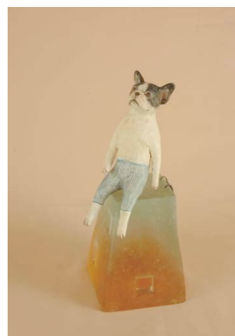
「屋上で・・・」 石粉粘土、ガラス 20.5×8.7×7.6 (H×W×D) cm 2014