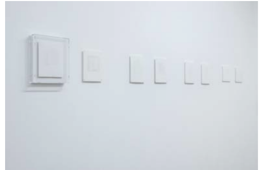
「紙の上の思考／Thoughts through Drawings」展示風景