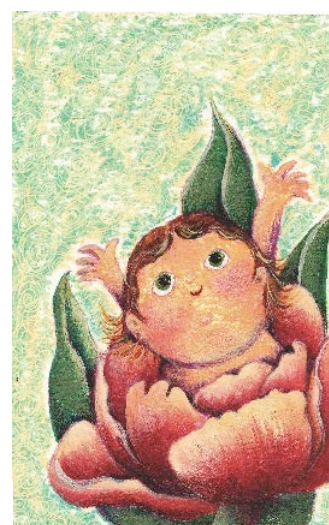
「おやゆび姫」 アクリル絵の具・クレパス 画用紙 86×143mm 2016

Life with Dog (Gallery 慳 SATORU 2016.5.21~6.5.) さんいんてん (にじ画廊 2016.7.7.~12.) ++ (タスタス) 第3回グループ展「むかしむかし。。。」 (代々木アートギャラリー)